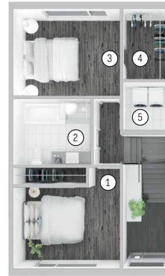
Plan du 2 e étage